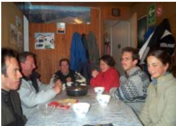
Séquence soupe à l'ognon