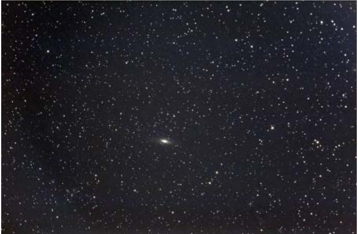
NGC 7331 - Lunette ORION de 80 mm et APN Canon 300 D