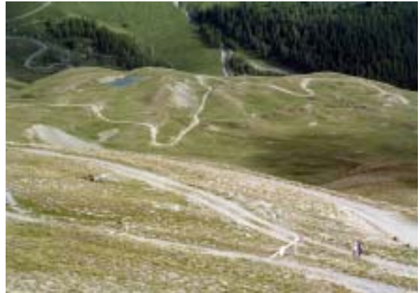
La montée au Pic