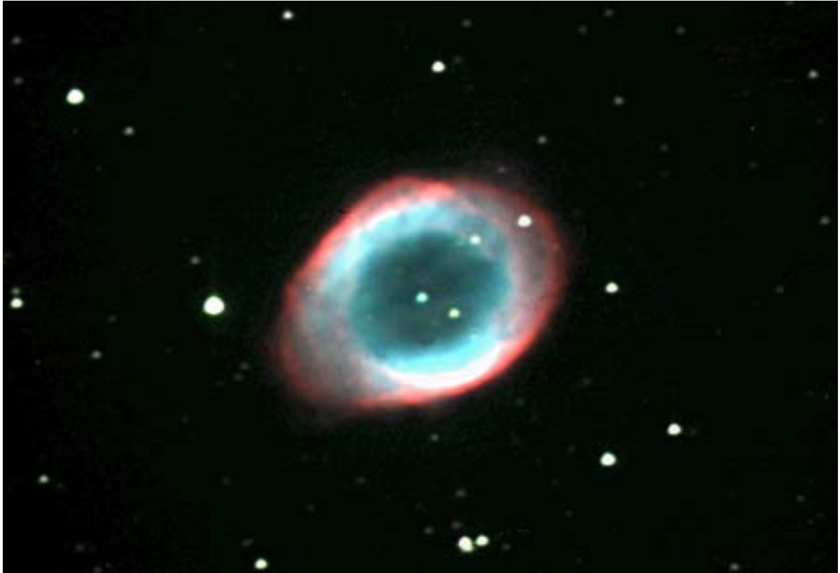
M57 - T620 - ST8E