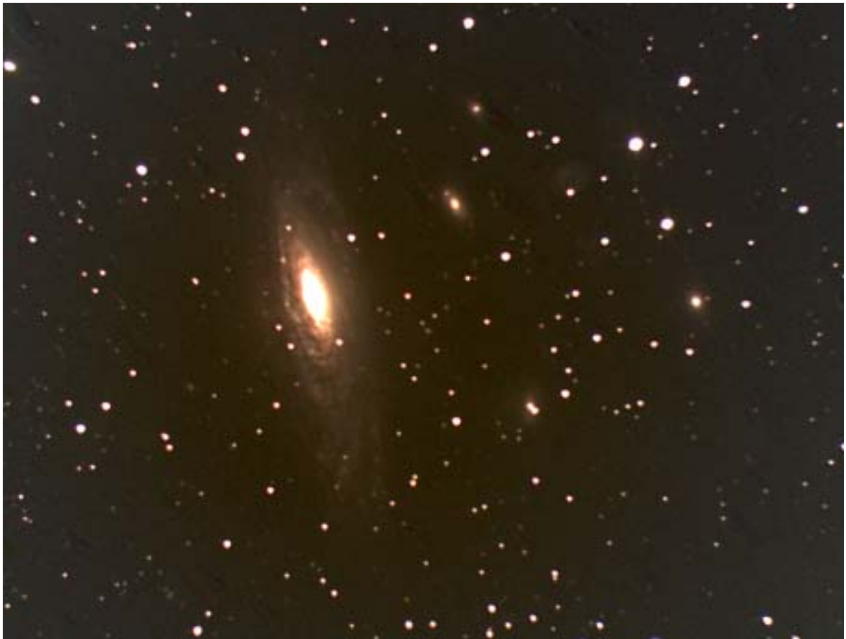
NGC 7331 - T620 - ST8E