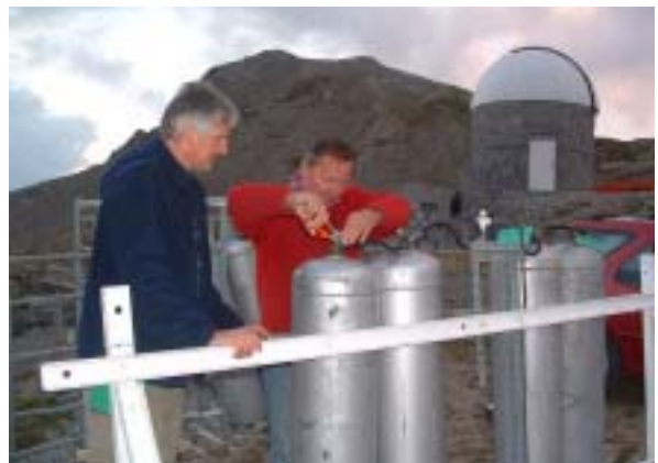
Un peu de gaz pour la cuisine