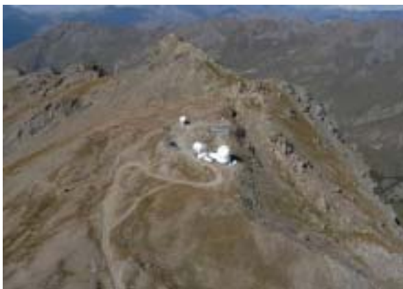
L'observatoire vu d'hélicoptère