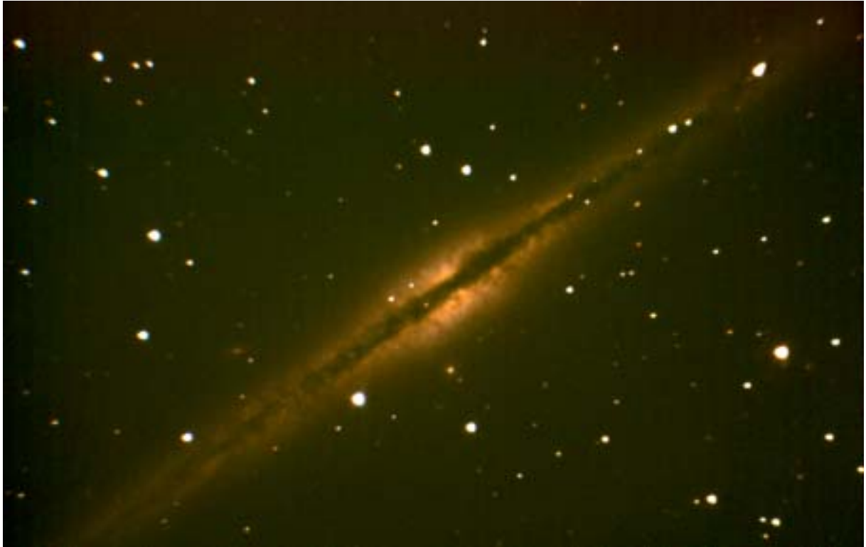
NGC 891 - T620 - ST8E