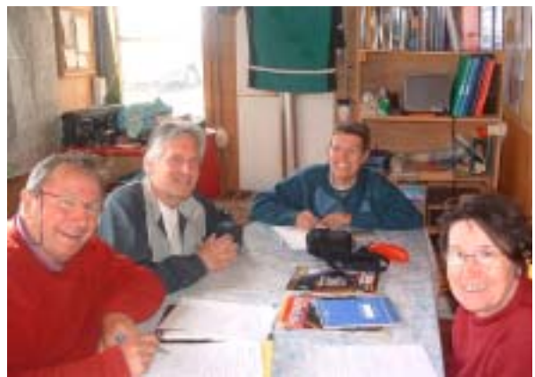
La préparation de la nuit d'observation