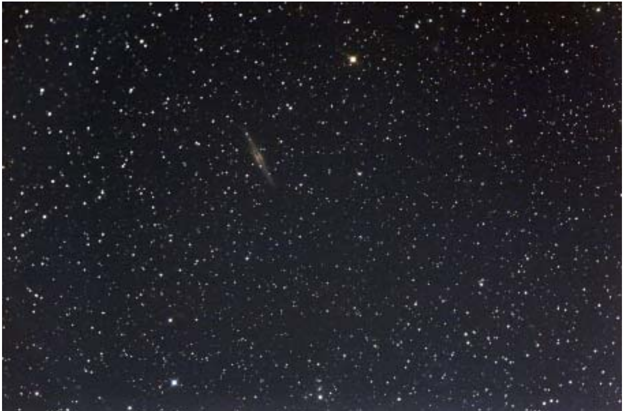
NGC 891 - Lunette ORION de 80 mm et APN Canon 300 D