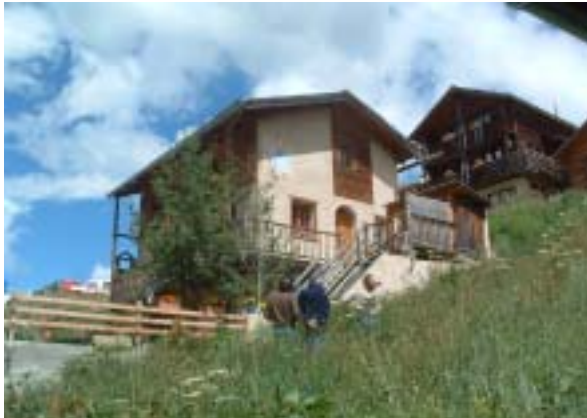
Cadran solaire à Saint-Véran