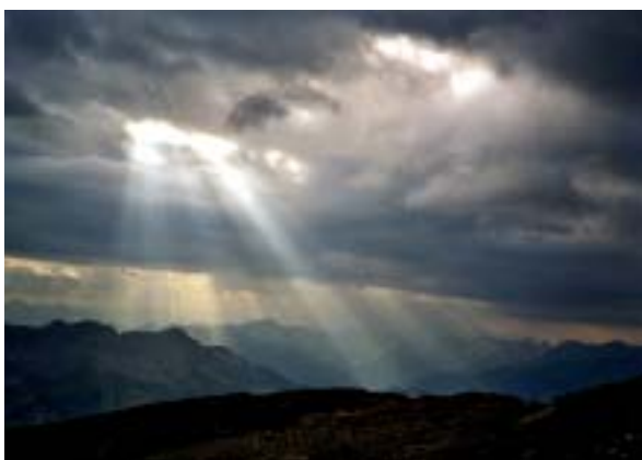
Belle image mais nuit d'observation compromise