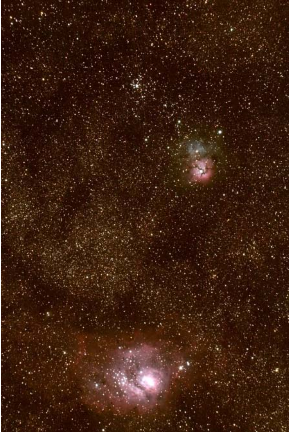
M20 et M8 - Lunette ORION de 80 mm et APN Canon 300 D