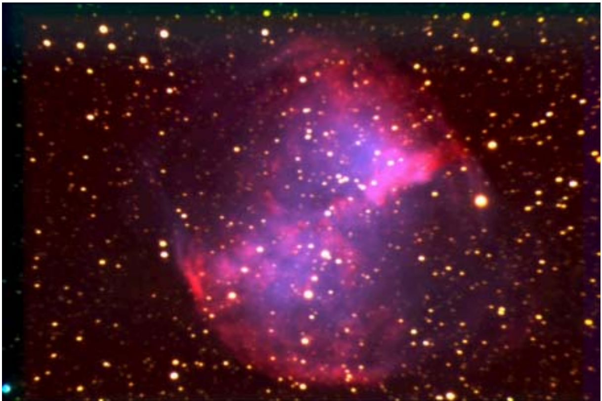
M27 - T620 + réducteur - ST8E