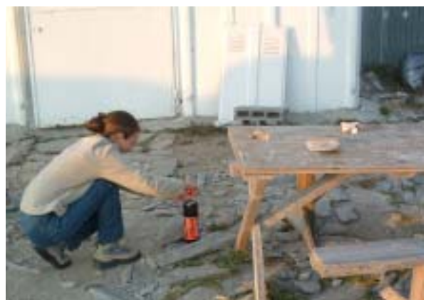
Une petite expérience de physique en altitude